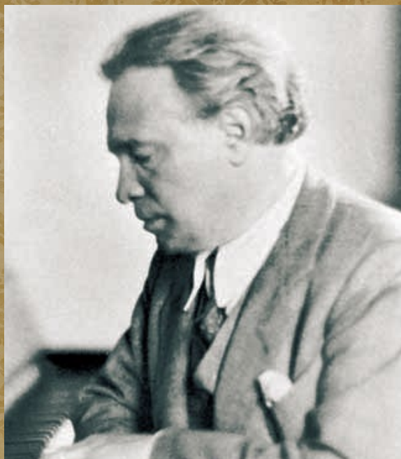
Ottorino Respighi, photography by Madeline Grimoldi at 1935